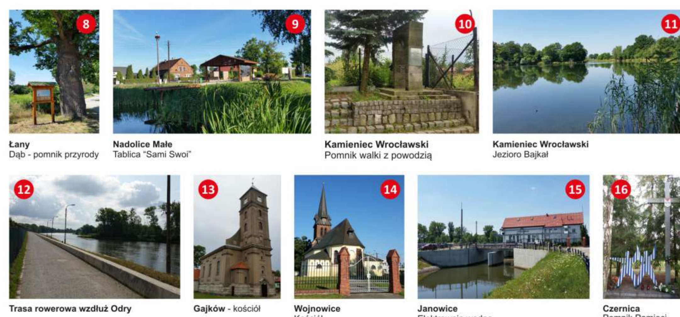
8 Łany Dąb - pomnik przyrody 9 Nadolice Małe Tablica "Sami Swoi" 10 Kamieniec Wrocławski Pomnik walki z powodzią 11 Kamieniec Wrocławski Jezero Bajkał 12 Trasa rowerowa wzdłuż Odry 13 Gajków - kościół 14 Wojnowice Kościół 15 Janowice Elektrownia wodna 16 Czernica Pomnik Pamięci Ofiar AEL Rattwitz