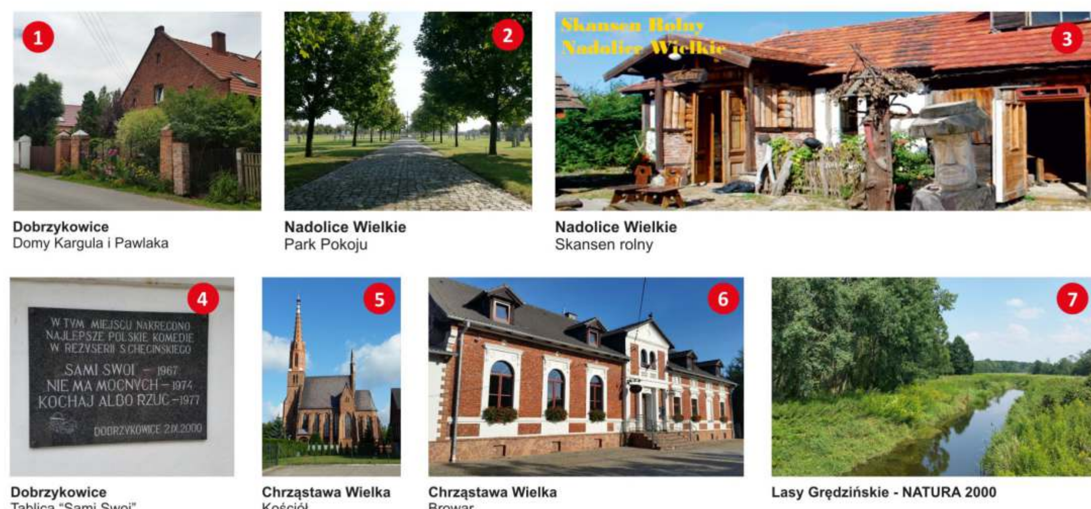
1 Dobrzykowice Domy Kargula i Pawlaka 2 Nadolice Wielkie Park Pokoju 3 Nadolice Wielkie Skansen rolny 4 Dobrzykowice Tablica "Sami Swoi" 5 Chrzastawa Wielka Kościół 6 Chrzastawa Wielka Browar 7 Lasy Grzędzińskie - NATURA 2000