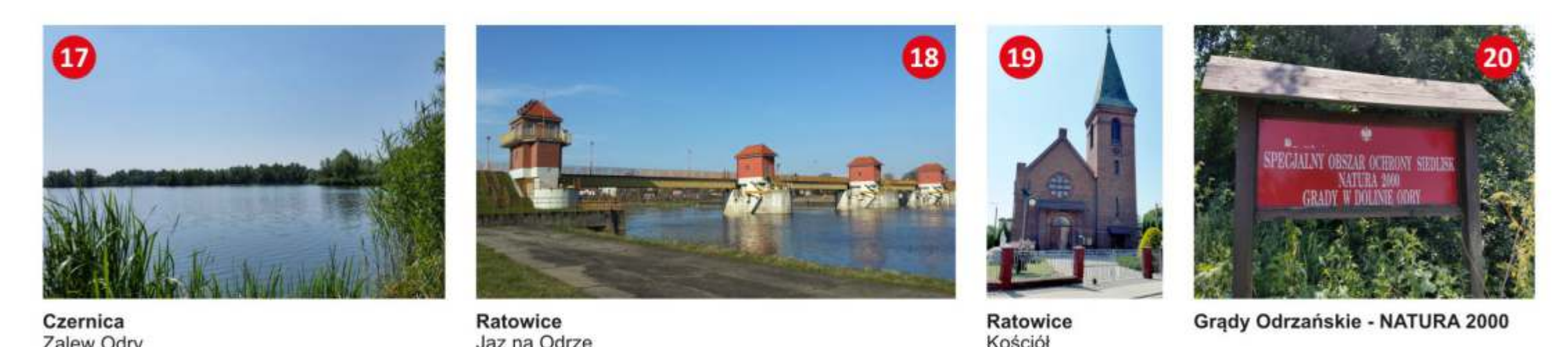
17 Czernica Zalew Odry 18 Ratowice Jaz na Odry 19 Ratowice Kościół 20 Grądy Odrzańskie - NATURA 2000