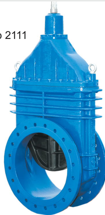
Na zdjęciu DN500