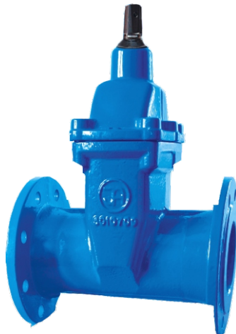
Na zdjęciu Dn80