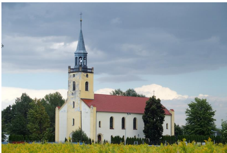
Zdjęcia nr 12. Kościół pw. MB Różańcowej w Nadolicach Wielkich

Kościół pw. MB Różańcowej w Nadolicach Wielkich , wcześniej ewangelicki, wzniesiony w latach 1847-1849, wg projektu inspektora budowlanego Zahna, neoromański. W 1862 r. zakończono przebudowę kościoła, w czasie której dostawiono do niego wieżę.