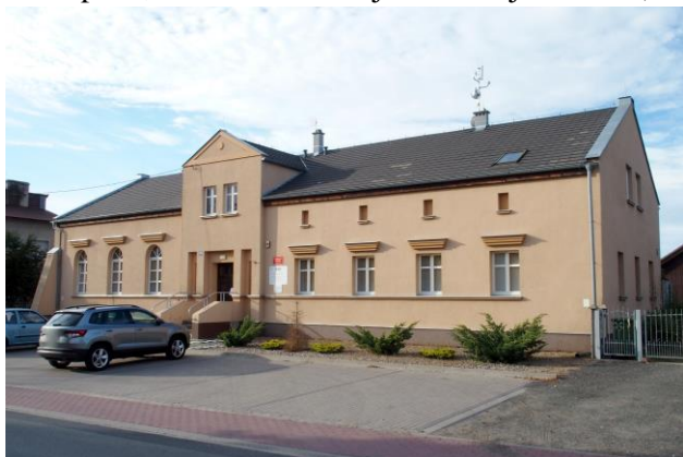
Zdjęcie nr 36. Gospoda, ob. świetlica wiejska w Wojnowicach, ul. Główna 41

– Gospoda, ob. świetlica wiejska w Wojnowicach, ul. Główna 41.