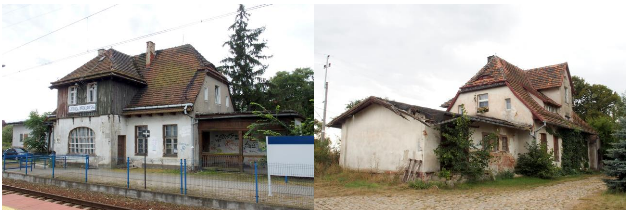
Zdjęcia: nr 17, 18. Dworzec w Czernicy i dworzec, ob. budynek mieszkalny w Nadolicach Wielkich

Budynki dworców pochodzą z końca pierwszej dekady XX w. i prezentują się dość jednorodnie; parterowe, nakryte wysokimi naczółkowymi dachami, z aneksami, o malowniczej bryle.