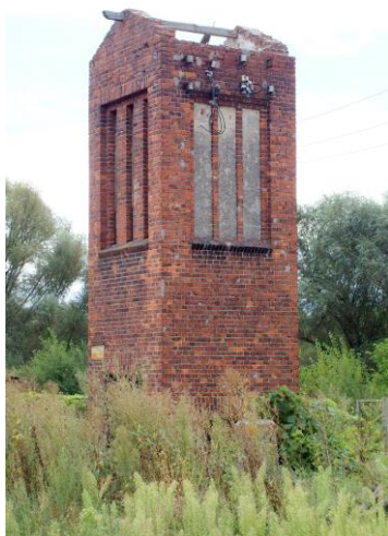
Zdjęcie nr 25. Transformator w Czernicy, ul. Kochanowskiego

– Transformator w Czernicy, ul. Kochanowskiego;