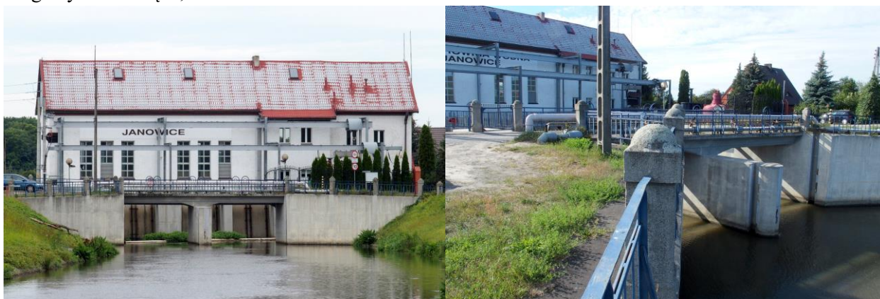
Zdjęcia nr 21, 22. Elektrownia wodna - stopień wodny „Janowice” i most drogowy nad służą w Jeszkowicach w zespole

– Infrastrukturę wodną w Jeszkowicach obejmującą: stopień wodny „Janowice”, elektrownię wodną, budynek dyżurki służby I, służbę komorową „Janowice I”, most drogowy nad służą, służbę komorową „Janowice II” i most drogowy nad służą II;