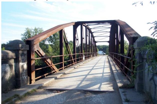
Zdjęcie nr 23. Most drogowy w Gajkowie na Kanale Janowickim

– Most drogowy w Gajkowie na Kanale Janowickim;