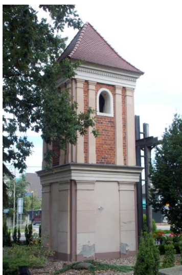
Zdjęcie nr 26. Dzwonnica pożarowa w Czernicy, ul. Wrocławska/Jana Pawła II

– Dzwonnica pożarowa w Czernicy, ul. Wrocławska/Jana Pawła II.