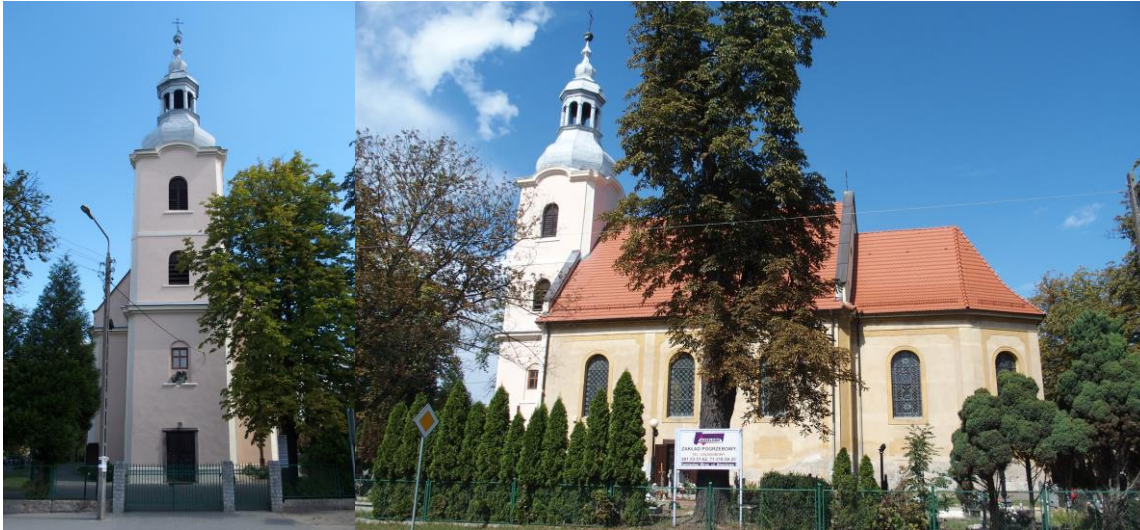
Zdjęcia nr 8, 9. Kościół pw. Narodzenia NMP w Dobrzykowicach