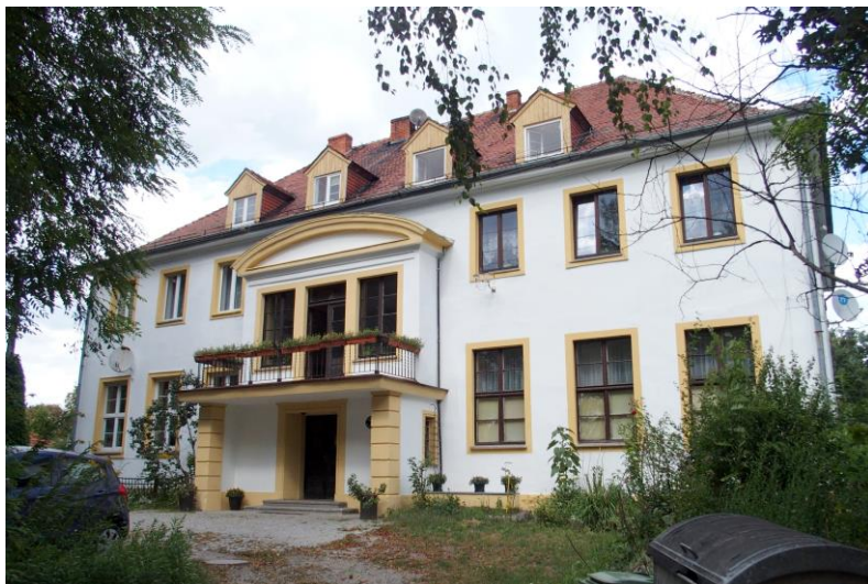
Zdjęcie nr 15. Pałac w zespole pałacowo-folwarcznym w Nadolicach Wielkich

Jedyną zachowaną rezydencją jest dwór w Nadolicach Wielkich – budynek murowany, tynkowany, na planie prostokąta, podpiwniczony, dwukondygnacyjny, nakryty dachem czterospadowym z lukarnami. Fasada (elewacja pld.) dziewięcioosiowa, z centralnym trzyosiowym ryzalitem, zaakcentowanym portykiem podtrzymującym balkon. Elewacje dworu remontowane: wokół otworów okiennych proste opaski w tynku.