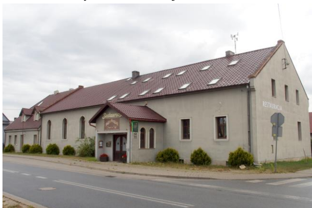
Zdjęcie nr 32. Dom ludowy, ob. restauracja w Nadolicach Wielkich, ul. Wrocławska 64

– Dom ludowy, ob. restauracja w Nadolicach Wielkich, ul. Wrocławska 64;