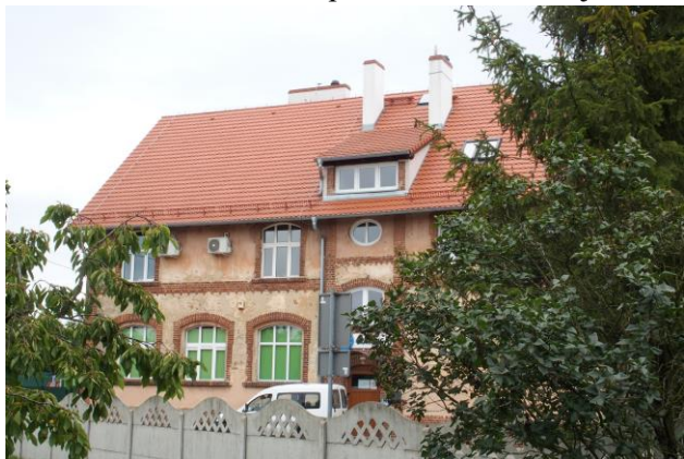
Zdjęcie nr 35. Szkoła, ob. Zakład Gospodarki Komunalnej w Ratowicach, ul. Wrocławska 111

– Szkoła, ob. Zakład Gospodarki Komunalnej w Ratowicach, ul. Wrocławska 111;