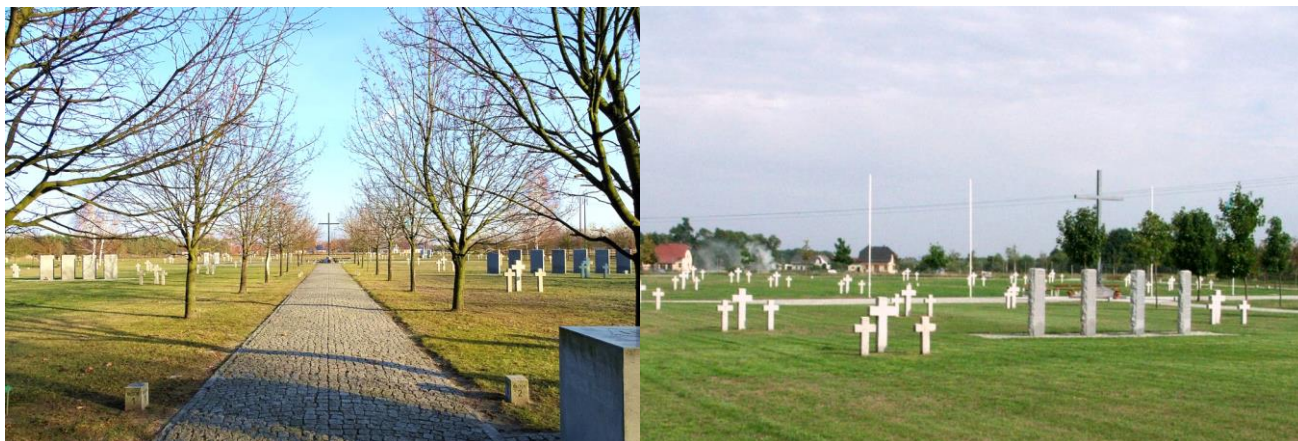
Zdjęcia nr 1, 2. Park Pokoju w Nadolicach Wielkich

W Nadolicach Wielkich znajduje się jedyny w Polsce i jeden z czterech w Europie niemiecki cmentarz wojenny i Park Pokoju. Jest to nekropolia żołnierzy niemieckich oficjalnie otwarta dnia 5 października 2002 r., celem wtórnego pochówku żołnierzy niemieckich czasów II wojny światowej ekshumowanych z terenów województw dolnośląskiego, opolskiego i lubuskiego. Nekropolia powstała w miejscu wcześniej nieużytkowanym na potrzeby grzebalne, początkowo na obszarze 1,75 ha. Uroczystego otwarcia obiektu dokonano 9.X.1998 r. Rozpoczęto wówczas nasadzanie drzew, kontynuowane w następnych latach. W 2002 r. zmieniono nazwę obiektu na Cmentarz wojenny żołnierzy niemieckich z lat 1939-1945 i Park Pokoju. Prace związane z przeniesieniem zwłok i z urządzeniem nekropolii pokryto z funduszy niemieckich, a ich organizacją i urządzeniem kompleksu cmentarnego zajmowała się Fundacja Pamięć.