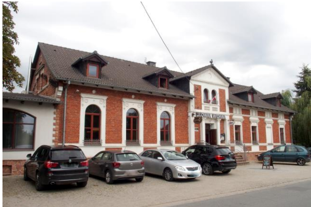
Zdjęcie nr 27. Dom Ludowy, ob. restauracja w Chrzastawie Małej, ul. Wrocławska 97

– Dom Ludowy, ob. restauracja w Chrzastawie Małej, ul. Wrocławska 97;