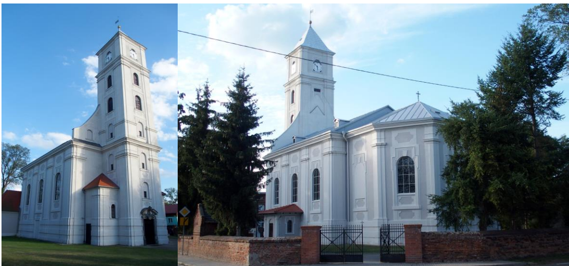
Zdjęcia nr 10, 11. Kościół pw. św. Małgorzaty w Gajkowie

Kościół pw. św. Małgorzaty w Gajkowie , barokowy, wzniesiony w latach 1711-1716 przez mistrza murarskiego Jacoba Straube, staraniem Ignatiusa Magneta, mistrza wrocławskich Krzyżowców z Czerwoną Gwiazdą. W 1838 r., po pożarze nakryto wieżę namiotowym hełmem. W 1897 r. dobudowa kruchty pld. I dwóch przybudówek wieży. W latach 1933-1934 – remont elewacji. Po zniszczeniach wojennych w latach 1945-1947 odbudowa prezbiterium i dachu, naprawa sklepień i malowanie wnętrza. W 1961 r. odnowienie elewacji, w 1963 r. – ustawienie ołtarza głównego (kopia ołtarza z nawy pñ. kościoła pw. NMP na Piasku we Wrocławiu). W 1992 r. wykonanie kamiennej posadzki.