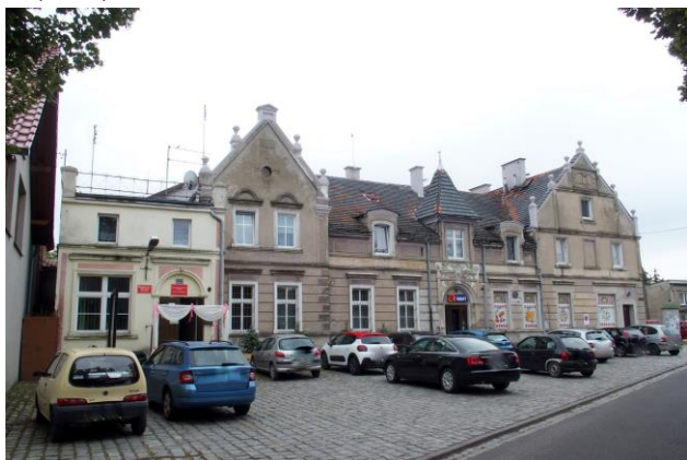
Zdjęcie nr 34. Gospoda, ob. budynek mieszkalno-usługowy (biblioteka, świetlica, sklep) w Ratowicach ul. Wrocławska 50, 52, 52a

– Gospoda, ob. budynek mieszkalno-usługowy (biblioteka, świetlica, sklep) w Ratowicach ul. Wrocławska 50, 52, 52a;