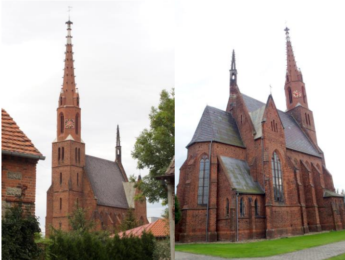
Zdjęcia nr 4, 5. Kościół pw. Niepokalanego Poczęcia NMP w Chrzastawie Wielkiej

Kościół halowy, trójnawowy, orientowany, na rzucie krzyża łacińskiego, z węższym i niższym prezbiterium zamkniętym ćwierćkoliście i z wieżą na osi elewacji zach., z wąską wieżyczką klatki schodowej od półn. Budynek oszkarpowany. Dachy dwuspadowe, kryte płytkami cementowymi, uzupełnione blachą, na wsch. krańcu dachu korpusu – smukła sygnaturka. Wieża w przyziemiu czworoboczna, w górnej kondygnacji ośmioboczna, zwieńczona smukłym murowanym z cegły stożkiem, zdobionym sterczynami z piaskowca, z pinaklem w zwieńczeniu. Detal architektoniczny ceglany: gzymsy, węgary i laskowania okien oraz z piaskowca: portale, sterczyny, żabki. Otwory okienne zamknięte ostrołucznie, w prezbiterium – witraże o tematyce roślinnej. Otwory wejściowe zamknięte łukiem dwuramiennym, w portalach z piaskowca. W tympanonie portalu zach. – inicjał „AL.” w tarczy herbowej i data „1860”; w zwieńczeniu – krzyże. Wewnątrz sklepienie krzyżowe.