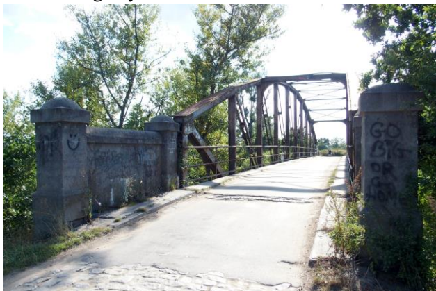
Zdjęcie nr 24. Most drogowy na kanale Janowickim w Kamieńcu Wrocławskim

– Most drogowy na kanale Janowickim w Kamieńcu Wrocławskim.