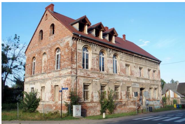
Zdjęcie nr 30. Dawny zajazd Jeltscha, ob. budynek nieużytkowany, Gajków, ul. Główna 50

– Dawny zajazd Jeltscha, ob. budynek nieużytkowany, obiekt wpisany do rejestru zabytków, Gajków, ul. Główna 50;