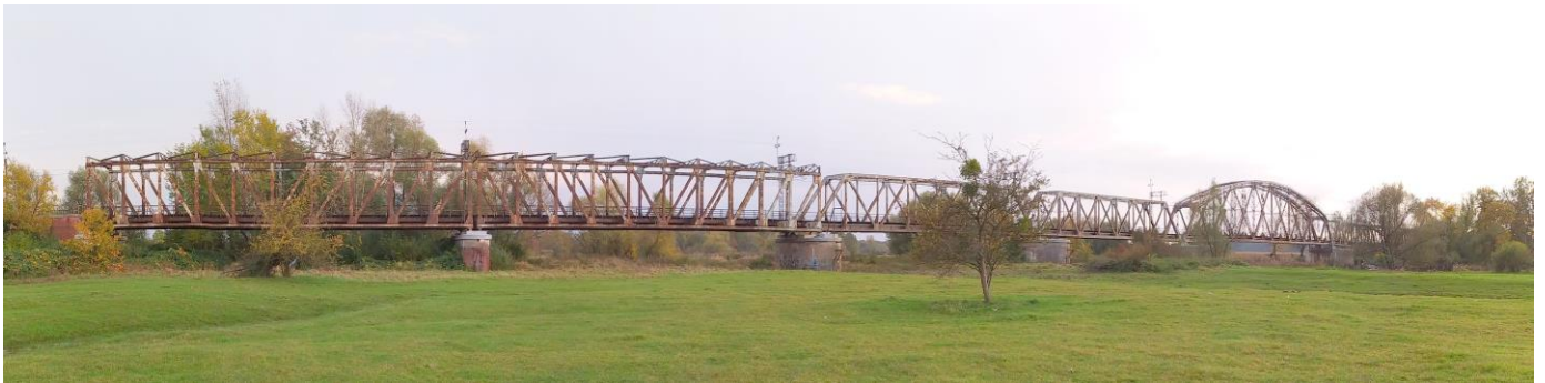
Zdjęcie nr 16. Most kolejowy w Czernicy

Budynki dworców pochodzą z końca pierwszej dekady XX w. i prezentują się dość jednorodnie; parterowe, nakryte wysokimi naczółkowymi dachami, z aneksami, o malowniczej bryle.