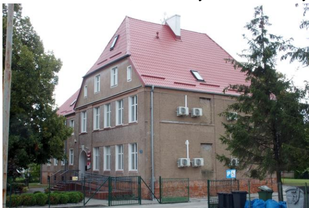
Zdjęcie nr 29. Szkoła Podstawowa, ob. Gminny Ośrodek Pomocy Społecznej w Czernicy, ul. Wrocławska 78

– Szkoła Podstawowa, ob. Gminny Ośrodek Pomocy Społecznej w Czernicy, ul. Wrocławska 78;