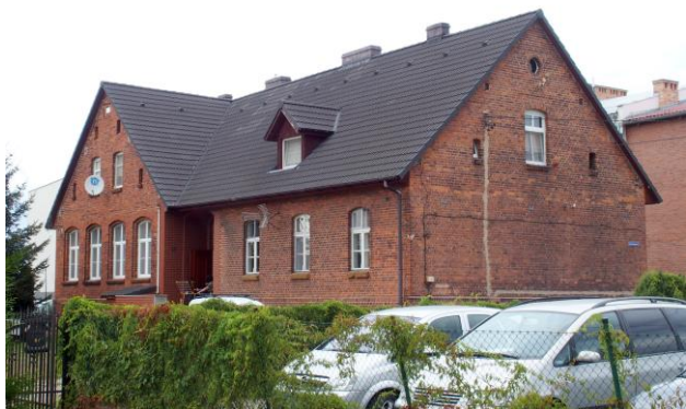
Zdjęcie nr 28. Szkoła parafialna, ob. budynek mieszkalny w Chrzastawie Wielkiej, ul. Wrocławska 15-17

– Szkoła parafialna, ob. budynek mieszkalny w Chrzastawie Wielkiej, ul. Wrocławska 15-17;