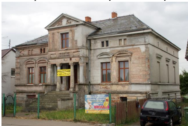
Zdjęcie nr 33. Szkoła podstawowa, ob. budynek mieszkalny w Nadolicach Wielkich, ul. Wrocławska 67

– Szkoła podstawowa, ob. budynek mieszkalny w Nadolicach Wielkich, ul. Wrocławska 67;