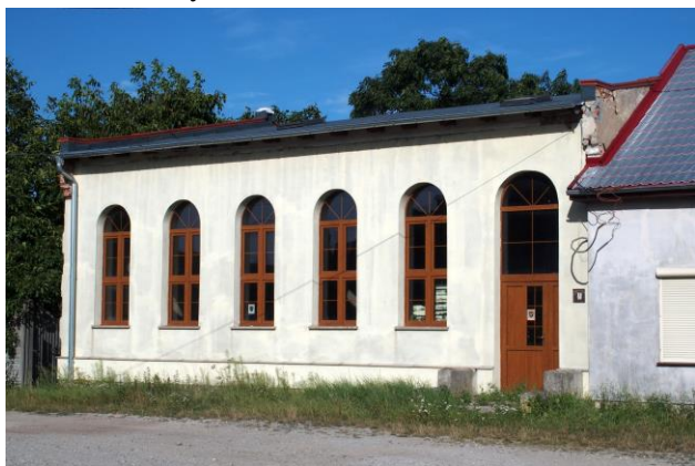
Zdjęcie nr 31. Dom Kultury w Jeszkowicach, ul. Główna 68a

– Dom Kultury w Jeszkowicach, ul. Główna 68a;