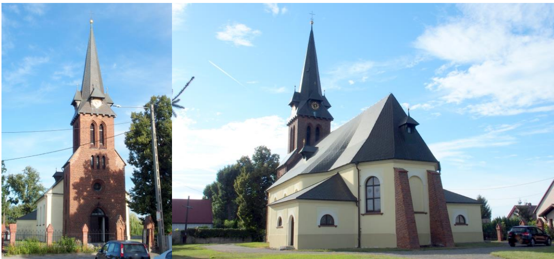
Zdjęcia nr 6, 7. Kościół pw. św. Wawrzyńca w Wojnowicach

Kościół pw. św. Wawrzyńca w Wojnowicach , wzniesiony na miejscu budowli z XV w., w latach 1801-1803, przebudowany w latach 1840-1842 (sygnaturka, przedsionek, dach); w 1889 r. dobudowano ceglana wieżę, odbudowaną po pożarze po uderzeniu pioruna w 1968 r. W 1934 r. dobudowano od wsch. ceglane szkarpy w celu wzmocnienia konstrukcji. Gruntowany remont w latach 1988-1999.