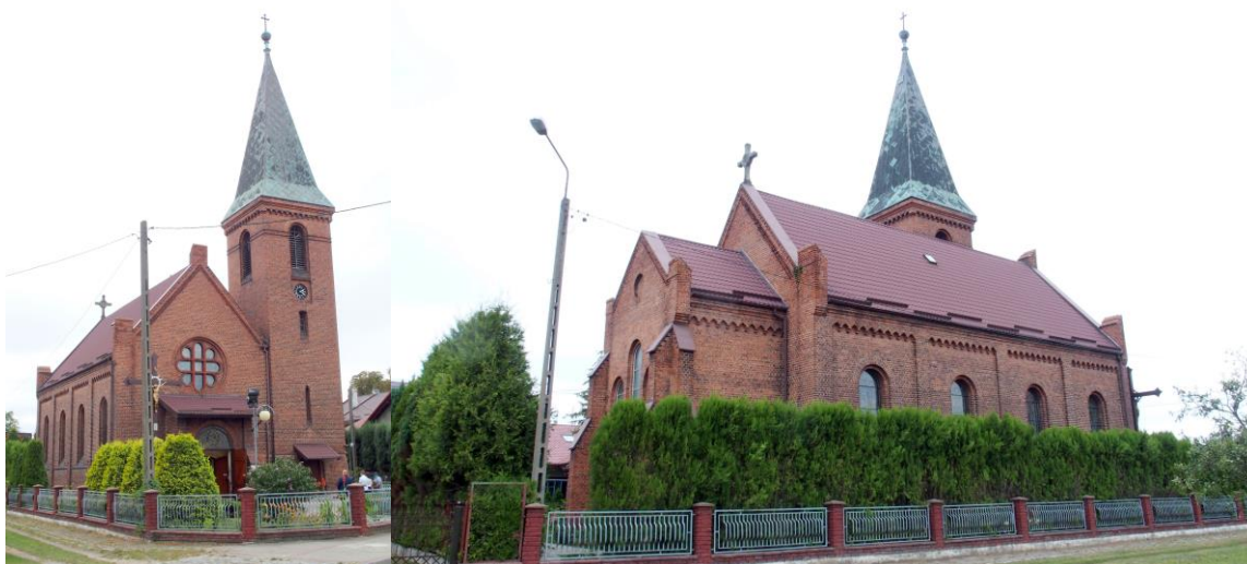
Zdjęcia nr 13, 14. Kościół pw. św. Antoniego w Ratowicach

Kościół murowany z cegły, na rzucie prostokąta, z prostokątnym, oszkarpowanym narożnie prezbiterium z towarzyszącą mu prostokątną zakrystią i z czworoboczną wieżą w narożniku fasady korpusu. Ściany murowane z cegły z ceglany detal: rozczłonkowane lizenami spiętymi w zwieńczeniu nadwieszonym fryzem arkadkowym. Podobny fryz w zwieńczeniu ścian prezbiterium. W dolnej kondygnacji okna koliste, w górnej – zamknięte łukiem okrągłym. W fasadzie płytka kruchta pod dachem pulpitu i wielkie przeszklone tondo z ceglany laskowaniem w formie stylizowanej rozety.