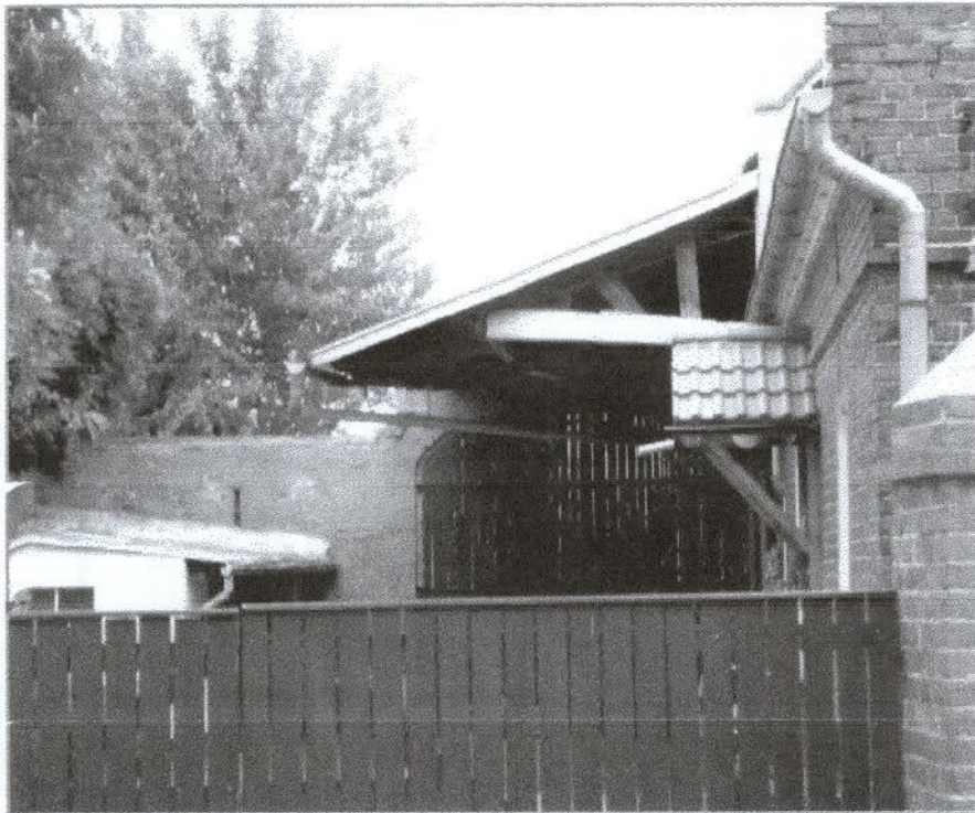
Podwórko Pawlaków i Kargulów